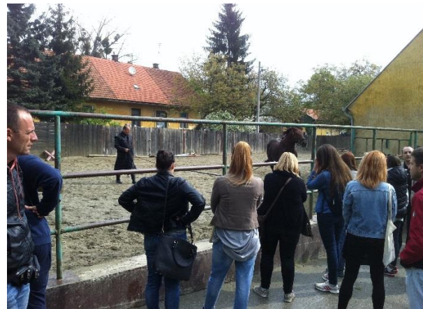
Agronomski fakultet Zagreb, Uzgoj i korištenje konja