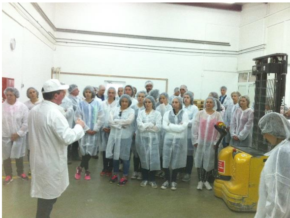
Ireks Aroma Jastrebarsko

Studenti i osoblje zainteresirani za dodatne informacije o programima mobilnosti mogu se obratiti Uredu za međunarodnu suradnju Sveučilišta. Ured za međunarodnu suradnju redovito organizira informativne aktivnosti vezane za programe mobilnosti čiji sažetak možete pronaći na mrežnim stranicama .